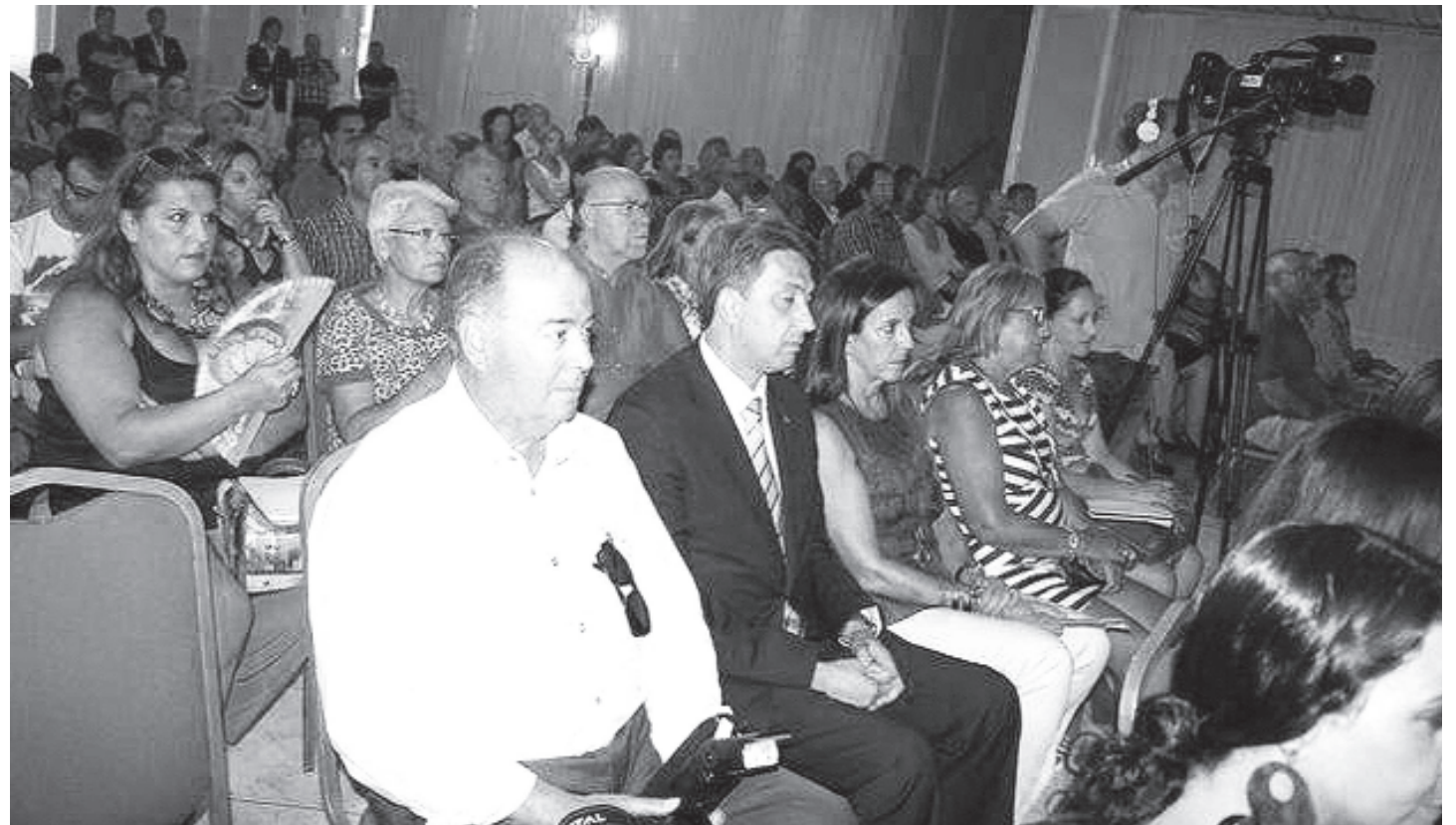
Los amplios salones del Hotel Reina Cristina al completo albergaban a más de 300 personas que siguieron muy interesadas durante todo el acto.