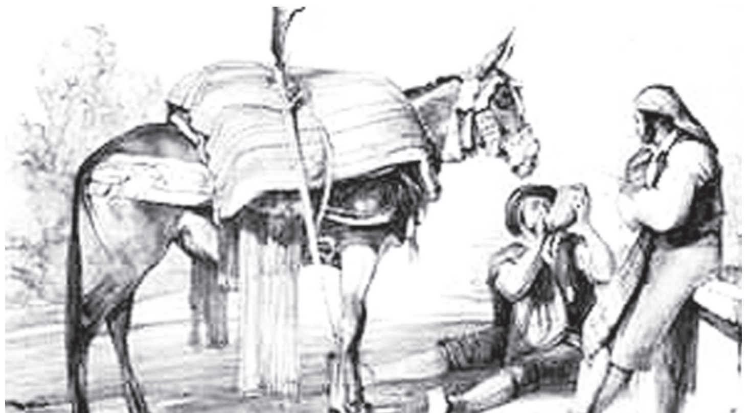
Numerosos viajeros románticos de la época recogieron en sus ilustraciones los momentos vividos en estos parajes, algunos inhóspitos de la sierra.

La visita a Algeciras era un deseo de los promotores que ven como el proyecto tiene larga vida